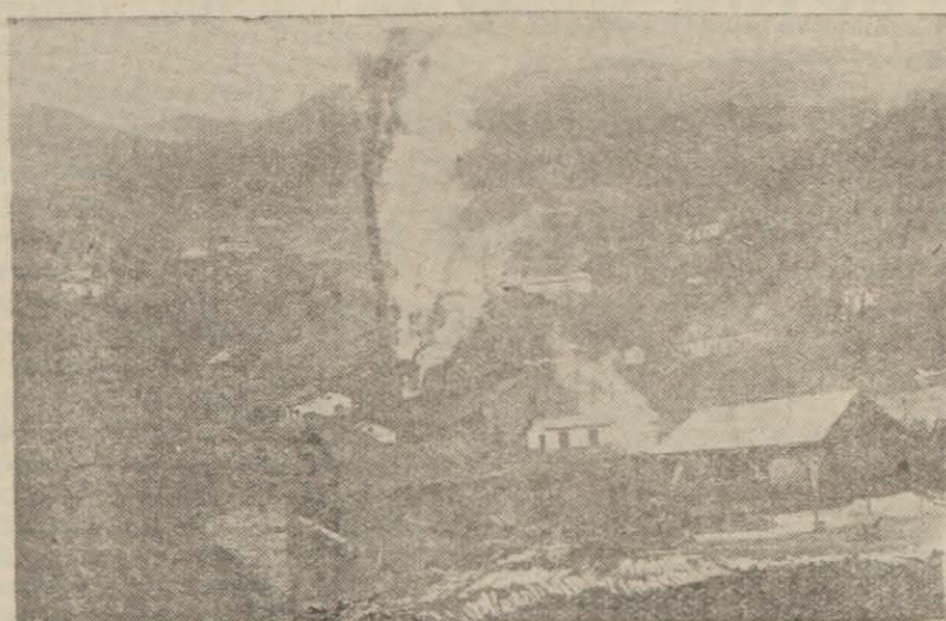
Ereğli kömür ocaklarından bir görünüş

Ankara 22 (Hususî) — Heyeti Vekile, Ereğli kömür havzası namide maruf sahanın Amasra - Amasra istismarının takası dahil - ve Ereğli kasabaları arasındaki kısmında mevcud üzerinde intifa hakkı tesis olunmuş veya kiraya verilmiş olsun olmasın, gerek imal ruhsat tezkereli ve gerek imtiyazlı faal ve gayrifaal metruk veya imtiyazlı feshedilmiş bütün ocakların devlete işletilmesine karar vermiştir.