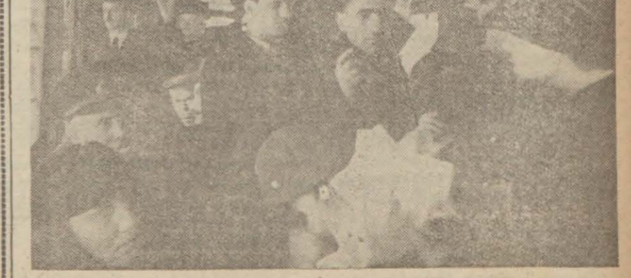
Tramvayların bugünkü hali

İdare, bu suretle arabalara çok yolcu alınacağını, izdihamın hafifleyeceğini ümit ediyor